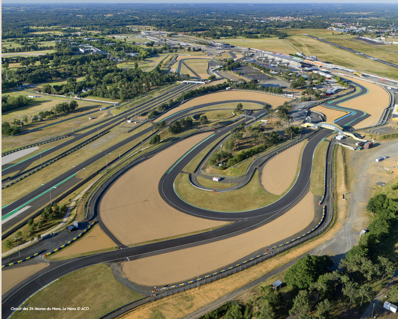
Circuit des 24 Heures du Mans, Le Mans

Le Musée des 24 heures vous accueille toute l'année pour vous faire revivre les grands moments de cette course, véritable légende du sport automobile.