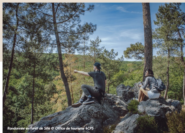
Randonnée en forêt de Sillé