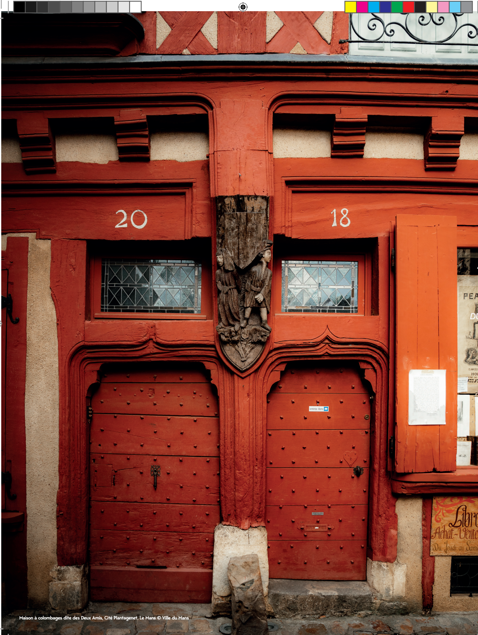
Maison à colombages dite des Deux Amis, Cité Plantagenet, Le Mans