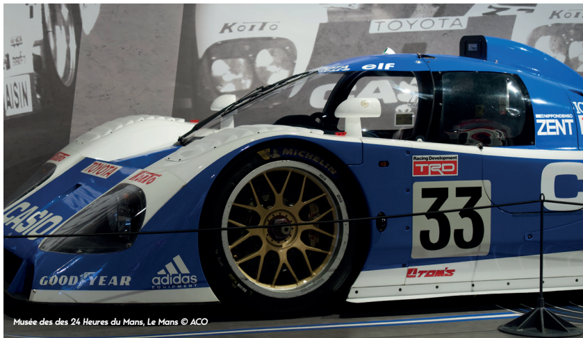
Musée des 24 Heures du Mans, Le Mans

La leggenda della 24 ore di Le Mans Gli appassionati dei motori qui sono a casa loro. Endurance o Gran Premio, due o quattro ruote, il circuito di Le Mans vi accoglie tutto l'anno con eventi di livello mondiale. Vivete emozioni forti alla guida di un prototipo della 24 ore di Le Mans. Presso il circuito "24H Karting" è possibile divertirsi alla guida di un go kart o provare uno dei simulatori di ultima generazione. Il museo della 24 ore è aperto tutto l'anno per farvi rivivere i momenti indimenticabili di questa corsa, vera leggenda dello sport automobilistico.