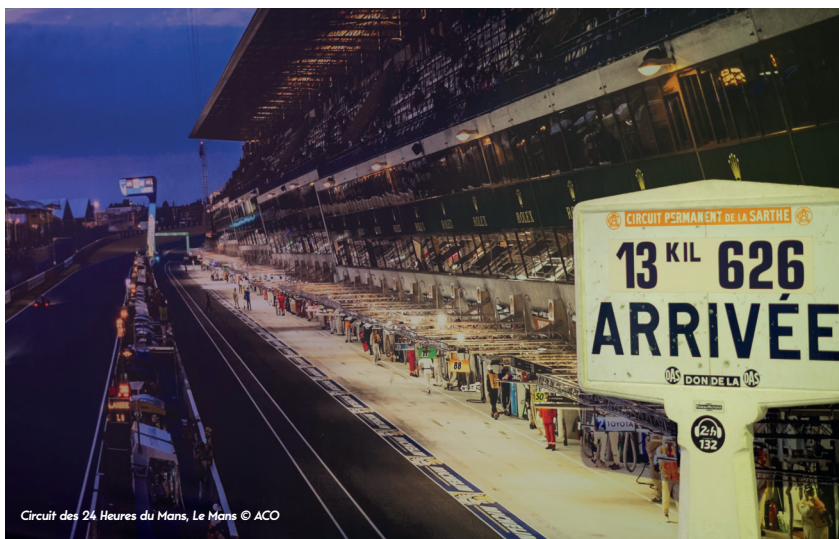
Circuit des 24 Heures du Mans, Le Mans