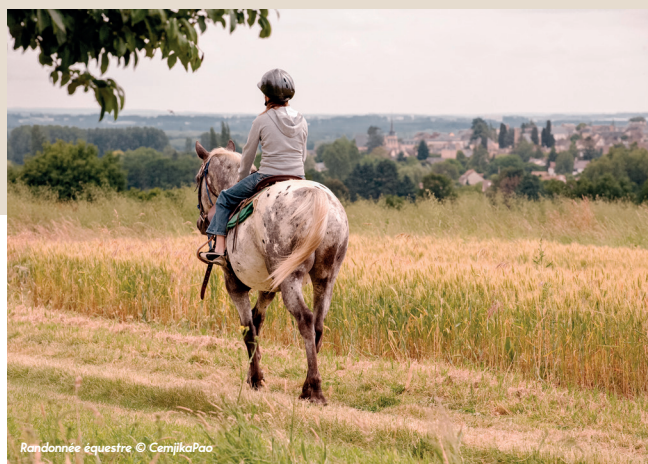
Randonnée équestre